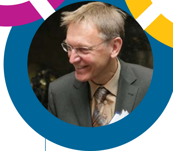
Janez Potočnik, EU Kommissar für Wissenschaft und Forschung

Die Förderung der Mobilität von Forschern in allen Phasen ihres Berufsweges ermöglicht den Austausch von Wissen über die Landesgrenzen hinaus, motiviert kollektive Forschungsarbeit und verstärkt die wirtschaftliche Nutzung von Forschungsergebnissen. Dies wiederum gewährleistet, dass Europa auch in der Zukunft ein herausragender wissenschaftlicher Forschungsstandort bleibt.