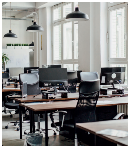
Ungenutzte Arbeitsplätze sind teuer und deshalb unerwünscht.

Viele Arbeitnehmende haben an Telearbeit Gefallen gefunden. Obwohl seit dem Lockdown im Frühjahr 2020 einige Beschäftigte wieder an ihren Arbeitsplatz zurückgekehrt sind, machen sich die Firmen nun Gedanken darüber, wie viel Bürofläche sie in Zukunft noch benötigen und für welche Zwecke das Firmenbüro in Zukunft genutzt werden soll. Der vorliegende Artikel geht der Frage nach: «Welche Berechtigung hat das Firmenbüro in Zukunft?»