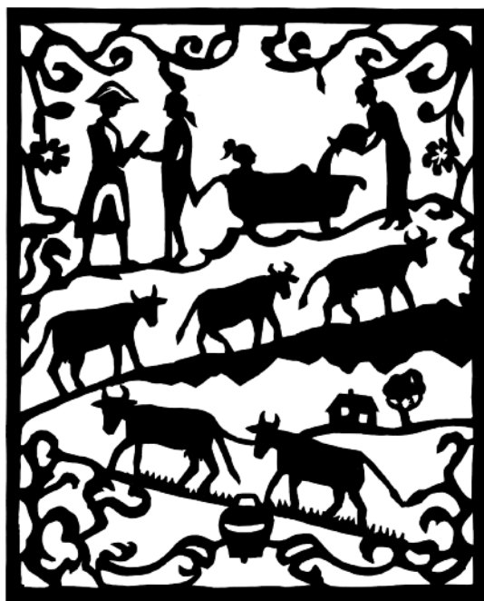
▲ Joséphine de Beauharnais, die vielbewunderte und einflussreiche erste Ehefrau von Napoleon Bonaparte, soll besonders gerne in Schweizer Kuhmilch gebadet haben – was sich die Berner zunutze machten.