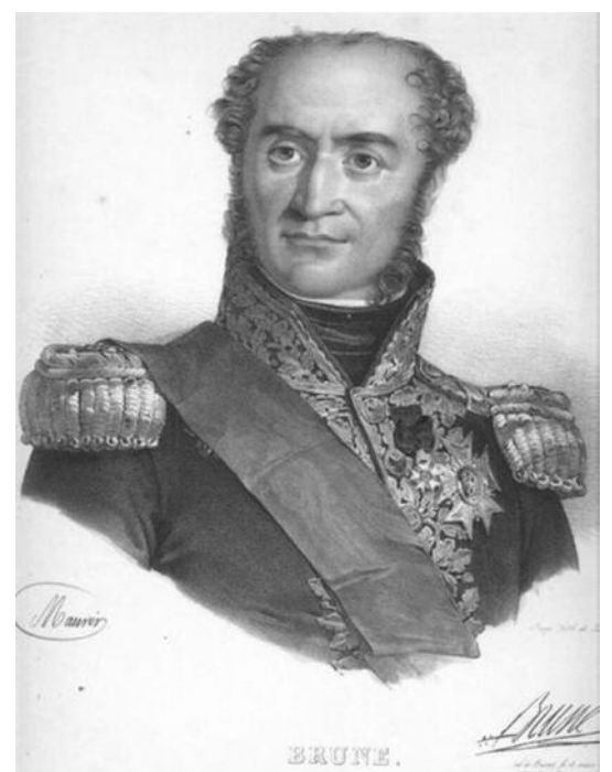
▲ Der französische General Guillaume Brune kümmerte sich unter anderem um den Berner Staatsschatz – durchaus auch zu seinem persönlichen Nutzen.

Der geraubte Goldschatz war zwar perdu, aber die Wertpapiere wollte sich Bern um fast jeden Preis wiederbeschaffen. Kaum war von Jenner Ende März 1798 mit den Berner Wertpapieren im Gepäck zur Übergabe in Paris angekommen, lag bereits eine französische Rückkauf-Offerte auf dem Tisch – für die geraubten englischen Wertpapiere. Denn die waren, wie sich herausgestellt hatte, für Frankreich wertlos, weil die Engländer weiterhin die Stadt und Republik Bern als einzig rechtmässige Besitzerin der Papiere ansahen. Frankreich konnte – wie später auch die helvetische Zentralregierung – die Papiere deshalb nicht verkaufen. Bern aber schon – und so beeilte sich von Jenner, die Vorbedingungen der Franzosen für eine Vertragsverhandlung zu erfüllen. Er verteilte rund 60 000 Livre an Bestechungsgeldern und schmierte zudem die «caisse noire» des Di-