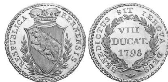
▲ Mit solch wertvollen Dukaten aus Gold wurde nicht bezahlt, sondern verdiente Bürger oder Diplomaten ausgezeichnet, sagt Markus Beyeler. Münzen aus dem Staatsschatz sind heute teure Raritäten, weil fast alle von den Franzosen eingeschmolzen wurden.