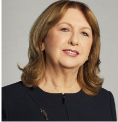
Prof. Dr. Dr. h.c. Mary Patricia McAleese

Mary McAleese ist Juristin und Rechtsanwältin, war von 1997 – 2011 Präsidentin der Republik Irland und ist seit 2018 als Professor of Children, Law and Religion an der Universität von Glasgow tätig. In ihrer Forschung legt sie den Fokus auf durchsetzbare Schutzrechte von Kindern und die Freiheitsrechte aller Gläubigen. In ihrer Dissertation Children's Rights and Obligations in Canon Law fragt sie nach den Rechten von Kindern im Kirchenrecht, wobei sie die UN-Kinderrechtskonvention von 1989 ins Zentrum stellt.