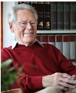
Theologe und Philosoph Hans Küng (* 19. März 1928 in Sursee, † 6. April 2021 in Tübingen)

In Zusammenarbeit mit der Stiftung Weltethos Schweiz laden das Ökumenische Institut Luzern und das Institut für Sozialethik ISE der Theologischen Fakultät der Universität Luzern jährlich zu einer öffentlichen Hans Küng – Weltethos Lecture ein. Die Vorlesungsreihe diskutiert und entwickelt das von Hans Küng gegründete Projekt «Weltethos» sowie das Denken von Hans Küng weiter.