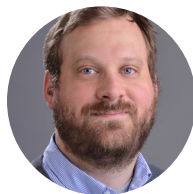
RABBINER JEHOSHUA AHRENS

«Luzern ist auch ein guter Ort für jüdische Studierende. Kompetenz in jüdisch-christlicher Beziehung bereitet auf Arbeitsstellen in jüdischen Institutionen vor, zu denen der Austausch mit der Gesellschaft gehört.»