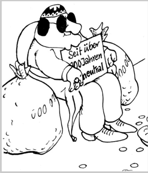
Bild 1: Illustration aus der Zeitschrift »Solidarität« (Nr. 40, Jg. 5, Okt. 1979, S. 6)

Innerhalb weniger Jahre entstand in der Schweiz rund um die Entwicklungsproblematik eine Vielzahl von Positionen, die sich grob in drei Gruppen gliedern lassen: Rechts standen die Entwicklungsскеptiker, die Steuergelder nur im Inland zum Ausgleich ökonomischer Differenzen verwenden wollten. Links standen die »Entwicklungsextremisten«, wie sie im Nationalrat einmal genannt wurden, 34 die das Wohlstandswachstum der Schweiz selbst