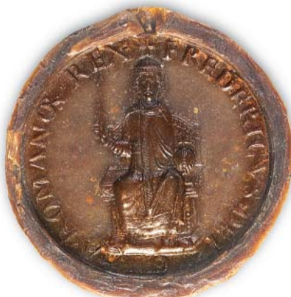
Auf seinem Siegelbild zeigt sich Kaiser Friedrich Barbarossa mit Reichsapfel und Zepter.