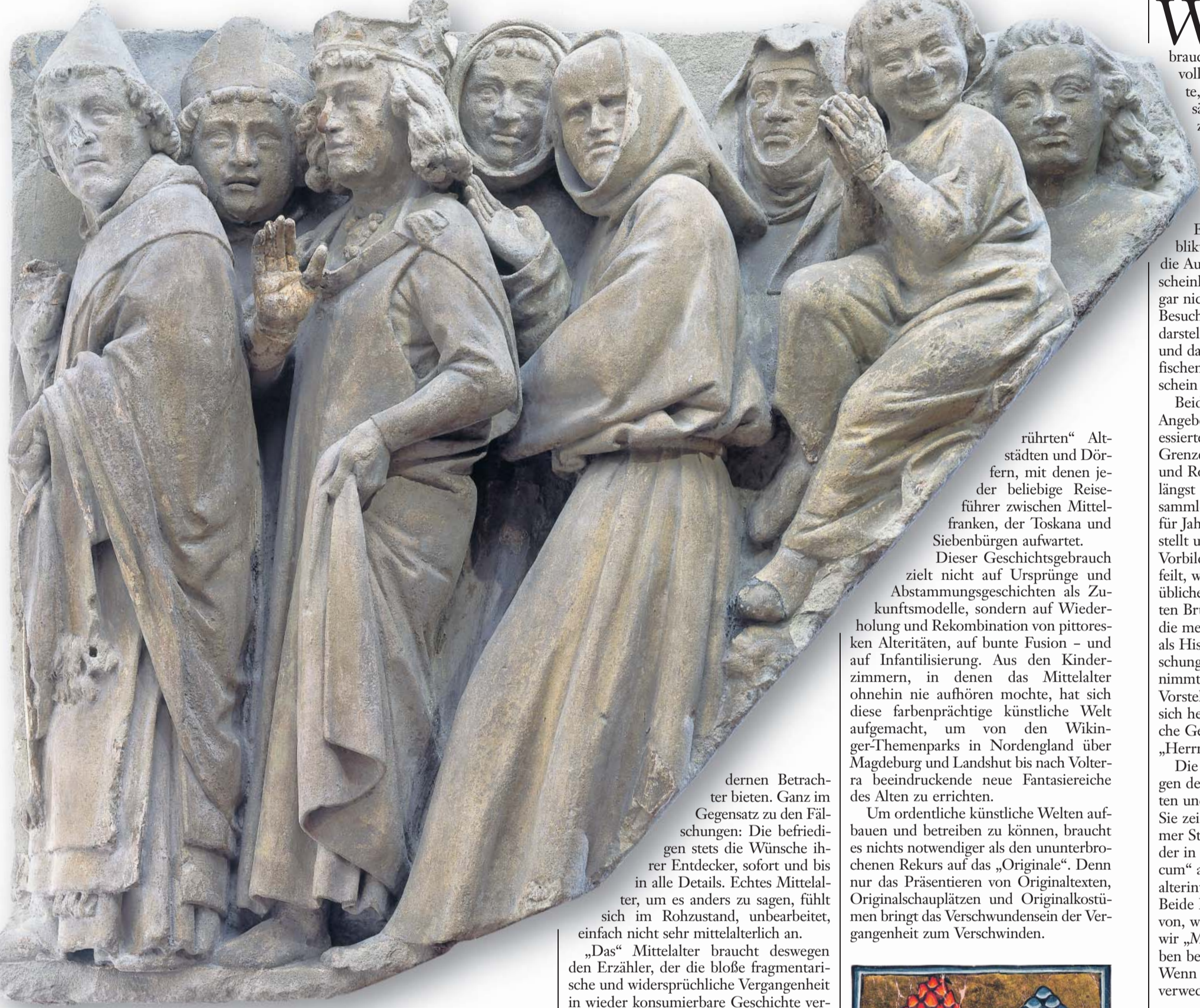
So sehen Selige aus: Eine um 1240 entstandene Figurengruppe aus dem Mainzer Dom

Deswegen die Einzahl. Das Mittelalter ist seither nicht nur ein Gefühlsort, sondern auch ein Erzählmodus, der ganz Unterschiedliches problemlos überwölbt und in Ursprungserzählungen eintopft. Denn auch die Wissenschaft vom Mittelalter entstand am Ende des 18. und am Beginn des 19. Jahrhunderts, und zwar unter einem doppelten Vorzeichen. Einmal war sie religiös – als Auseinandersetzung mit den Traditionen der katholischen Kirche; aufgeladen mit dem Bild einer vermeintlich ursprünglicheren, einfacheren und irgendwie reineren Epoche als Sehnsuchtsort. In Novallis' Aufsatz „Die Christenheit oder Europa“ von 1799 kann man nachlesen, dass es dabei nicht um Wiederherstellung von etwas Verlorenem ging, sondern um die mystische Auflösung einer „zerrissenen“ Gegenwart in einer frommeren Zukunft.