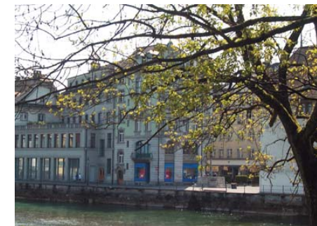
Universität Luzern, Theologische Fakultät