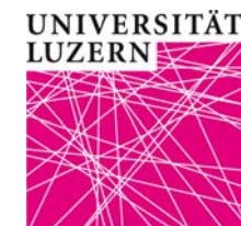
Professur für Kirchen- und Staatskirchenrecht