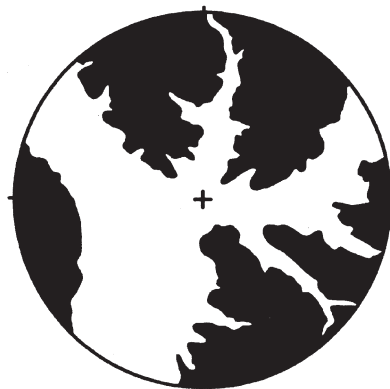
Abb. 1: Höhenlage des Stadtumkreises bei Städten am Adige. Stadtumkreis von 15 km Radius. Weiss: Gelände unter 1000 m ü. M., schwarz: Gelände über 1000 m ü. M.

Höhenlage der Stadt: 262 m ü. M. Vom Stadtumkreis unter 1000 m ü. M.: 47%