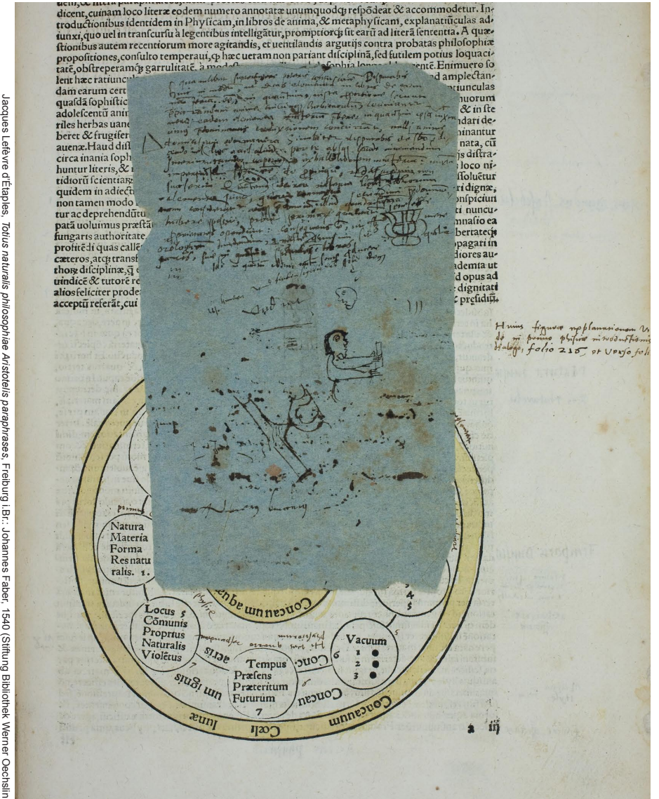
Jacques Lefèvre d'Étaples, Folius naturalis philosophiae Aristotelis paraphrases, Freiburg i.Br.: Johannes Faber, 1540 (Stiftung Bibliothek Werner Oechslin)

Eine Kooperation der Universität Luzern, der Universität Zürich und der Stiftung Bibliothek Werner Oechslin